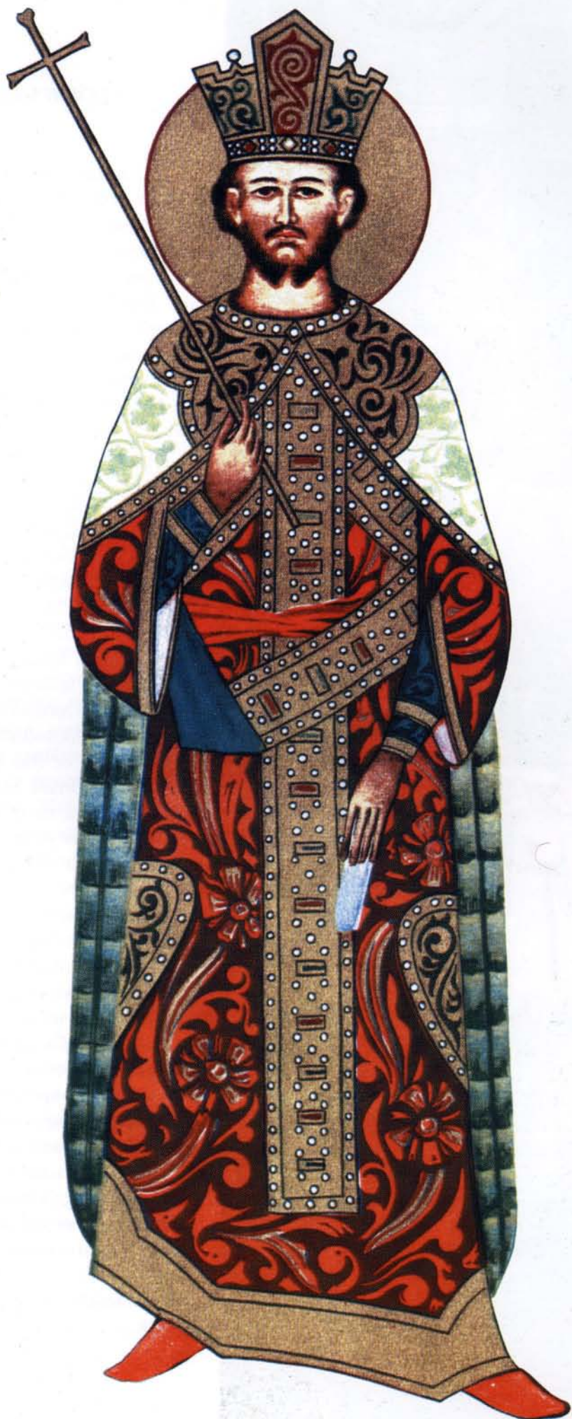
Десјош Ђурађ Бранковић